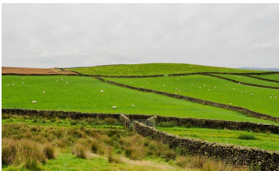
Photographie d'enclosures au Sud d'Hunter Bark

« Actuellement, dans notre « démocratie propriétaire » (britannique, n.d.l.r.), près de la moitié du pays appartient à 40 000 millionnaires fonciers, soit 0,06 % de la population, tandis que la plupart des autres passent la moitié de leur vie active à rembourser leur dette sur un terrain à peine assez grand pour accueillir une habitation et une corde à linge » 10 .