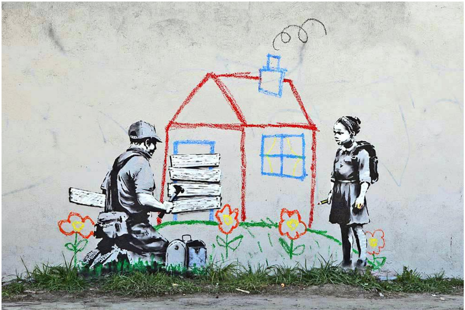
Banksy, « Crayon House Foreclosure », 2011

Une première approche du CLT à Bruxelles